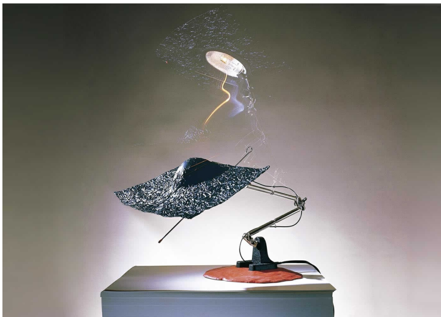
Don Quixote INGO MAURER UND TEAM 1989

Stahl, Aluminium, elastischer Kunststoff. Don Quixote biegt und schwenkt sich, dreht und streckt sich.