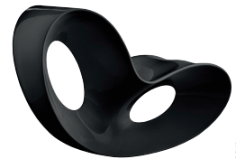
Indoor use Glossy colour: Black 1763 C