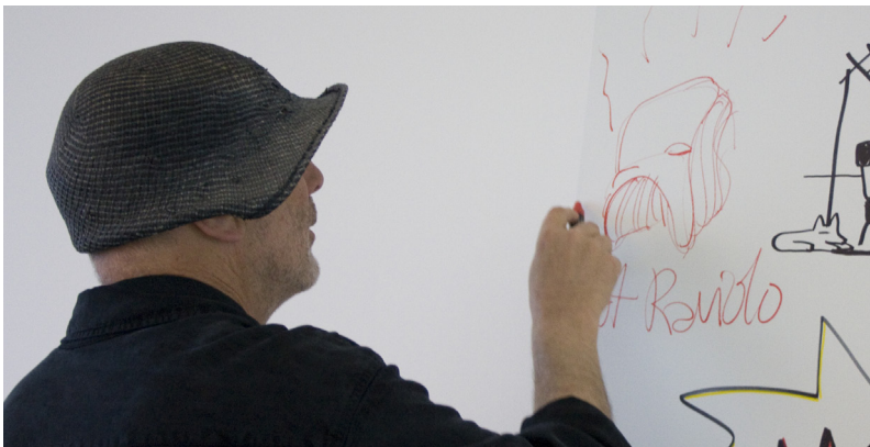
Designer bei Magis

zwei Ausführungen erhältlich: glänzend, in schwarz, bestens geeignet, um glamouröse Akzente in exklusive Räume zu setzen, oder matt, in verschiedenen Farben, um sich jedem Ambiente und Stil anzupassen, dank der wasser- und wetterfesten Eigenschaft von Polyäthylen auch im Aussenbereich einsetzbar.