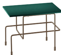
Indoor use Frame: Mahogany Brown 5015 Top: Green