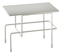
Outdoor use Frame: White 5011 Top: White Cataphoretically-treated version