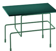
Indoor use Frame: Dark Green 5021 Top: Green