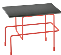
Indoor use Frame: Signal Red 5019 Top: Anthracite Grey