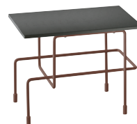
Indoor use Frame: Sepia Brown 5016 Top: Anthracite Grey