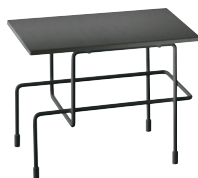
Indoor use Frame: Black 5013 Top: Anthracite Grey