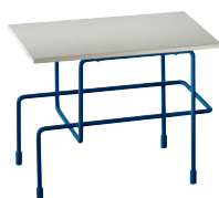
Indoor use Frame: Green Blue 5017 Top: White