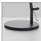
DEMETRA LED T BASE BCO 1733020A