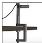
DEMETRA MORSETTO BCO 1744020A