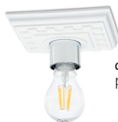
chrom glänzend (c) polished chrom