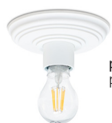
pulverbesch. weiß matt (RAL9016) powder-coated matt white