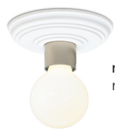
nickel matt (ni) nickel matt