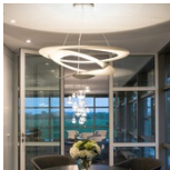
Office WHW Hillebrand