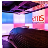
EMS Corporate office