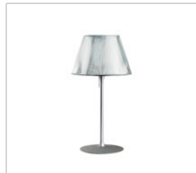
Romeo Moon T1 design by Philippe Starck