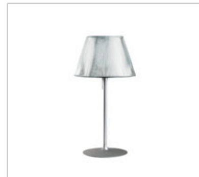
Romeo Moon T1 design by Philippe Starck