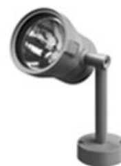
Faretto design by Piero Lissoni

Projecteur pour plafond/mur. Transformateur conventionnel intégré