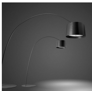
Twice as Twiggy