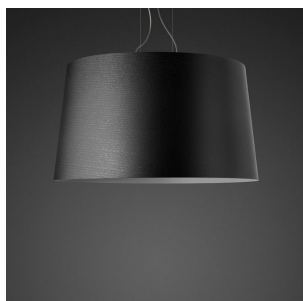
Twice as Twiggy