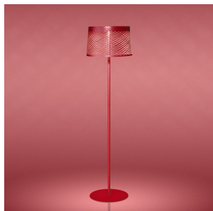
Twiggy Grid Lettura