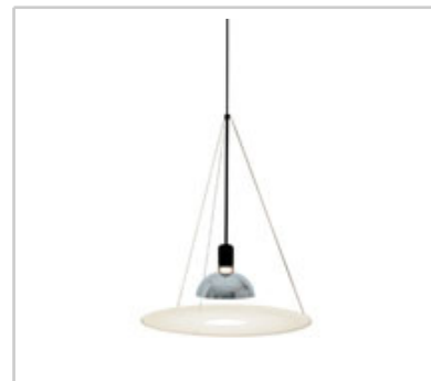
Frisbi design by Achille Castiglioni

Lámpara de suspensión de luz directa/indirecta y difusa