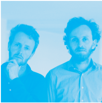
Ronan & Erwan Bouroullec

Ronan Bouroullec und Erwan Bouroullec arbeiten seit fast fünfzehn Jahren zusammen, ein ständiger Dialog, der durch zwei unterschiedliche Persönlichkeiten und das gemeinsame Bemühen um behutsame Ausgewogenheit bereichert wird. Seit 2004 arbeiten die Brüder Bouroullec auch mit Magis zusammen und designten mit Striped und Steelwood zwei komplette Kollektionen, ausserdem verschiedene Stühle und Tische sowie 2014 die neue Kollektion Officina.