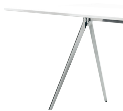
Indoor use Frame: Polished