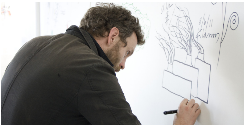
Designer bei Magis