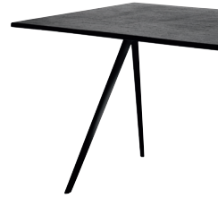
Outdoor use Frame: Black 5140