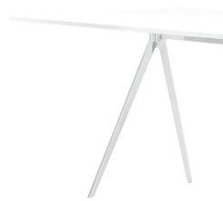
Outdoor use Frame: White 5108