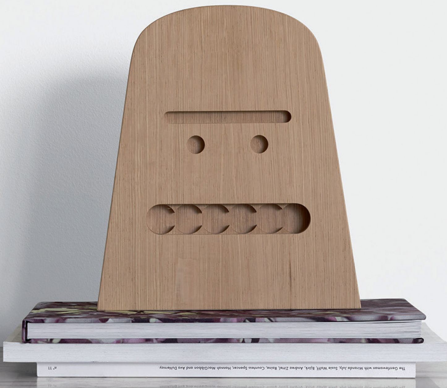
AC17 BIG B OBJEKT / OBJECT EICHE, UNBEHANDELT / OAK, UNTREATED